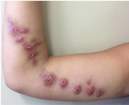
Figura 4: Nódulos avermelhados evoluindo para ulceração em um braço.

Em humanos, a ocorrência desta infecção frequentemente está associada à exposição ocupacional, sendo mais comum em indivíduos que atuam em ambientes rurais ou que mantêm contato diário com gatos domésticos 1,2 . Nestes hospedeiros, frequentemente as lesões se desenvolvem sob a forma cutâneo-linfática, que inicia como um pequeno nódulo avermelhado no local de inoculação geralmente em mãos, braços ou rosto e evolui para úlceras dolorosas como mostrado na figura 4, podendo seguir o trajeto dos vasos linfáticos. As lesões têm aspecto granulomatoso e podem persistir por semanas ou meses se não tratadas. Essas manifestações clínicas são importantes para o diagnóstico, pois diferem de outras doenças de pele pela associação com gatos infectados e pelo caráter ulcerativo e de difícil cicatrização 3 .