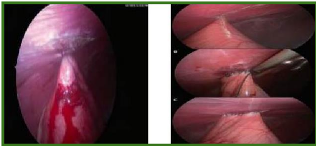
Figura 5: Gastropexia laparoscópica em cão. (Fonte: Yaghobian, S., et al.)

As vantagens da laparoscopia são marcantes e diretamente relacionadas à sua característica minimamente invasiva, resultando em menor dor pós-operatória, tempo de hospitalização reduzido, retorno mais rápido do paciente às suas atividades normais e um melhor resultado estético devido às incisões mínimas. Além disso, a visão ampliada e magnificada auxilia na precisão dos movimentos cirúrgicos [1, 2, 3, 4].