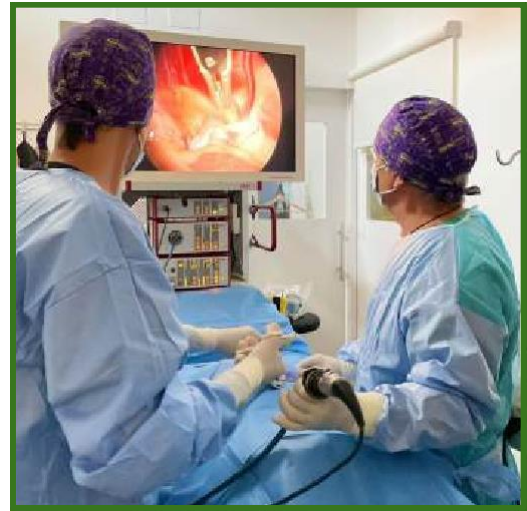
Figura 1: Cirurgia laparoscópica veterinária.

A cirurgia laparoscópica baseia-se na coordenação entre o sistema de visualização (o laparoscópio) e os instrumentos de trabalho. Após a insuflação da cavidade abdominal com dióxido de carbono (CO 2 ) para criar o espaço de trabalho visualizado no monitor, o cirurgião insere o laparoscópio através de um primeiro portal, geralmente de 10mm, como ilustrados na Figura 1. Sob a visão fornecida por essa câmera, outros trocates (tubos de acesso) são introduzidos através de pequenas incisões adicionais na parede abdominal. É por meio desses portais que todos os instrumentos cirúrgicos são inseridos. Diferentemente dos instrumentos de cirurgia aberta, as ferramentas laparoscópicas, como pinças (Figura 2), tesouras, bisturis harmônicos e porta-agulhas, são longas, finas e articuladas na ponta, com diâmetros que geralmente variam de 3mm a 12mm, para se ajustarem aos orifícios dos trocates. O cirurgião manipula a ponta desses instrumentos usando manípulos localizados fora do corpo do paciente [2]. É necessário planejar cuidadosamente e considerar o posicionamento do paciente, o posicionamento da torre, a disposição da equipe cirúrgica e a localização da mesa de instrumentos. Além disso, o treinamento do cirurgião é de extrema importância, sendo realizado através de cursos e séries de exercícios em simuladores, já consolidados na medicina humana e em processo de adaptação para a medicina veterinária [5].