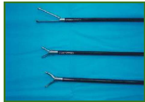
Figura 2: Exemplos de pinças laparoscópicas: pinça de Babcock, pinça de Reddic-Olsen, pinça de Kelly. (Fonte: Jaskólska, I., et al.)

Os procedimentos mais frequentemente realizados incluem ovariectomia e ovariectomia laparoscópica (Figuras 3 e 4), bem como biópsias hepáticas, esplênicas e de linfonodos, gastropexias (Figura 5), esplenectomias assistidas e adrenalectomias em centros especializados [5]. Abordagens reduzidas como SILS (single-incision laparoscopic surgery) também têm sido aplicadas com resultados promissores, embora possam exigir maior habilidade técnica [6].