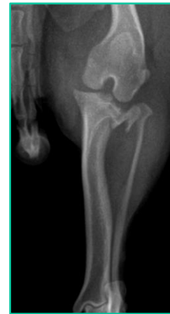
Figura 2: Radiografia pré-operatória crânio-caudal de membro pélvico esquerdo de cão, da raça shihtzu, de 7 anos, evidenciando a fratura em platô tibial.

A técnica cirúrgica consistiu em incisão crânio medial da pele em região da articulação do joelho e parte proximal da tíbia com divulsão dos tecidos subcutâneos, incisão da fáscia lata e divulsão da musculatura tibial cranial com exposição da região da fratura. Foi realizada artrotomia para inspeção dos meniscos e do ligamento cruzado cranial - que estava rompido. A redução dos fragmentos que acometiam o platô tibial foi feita com pinça de redução ponta a ponta e a fixação foi realizada com parafuso cortical 2.0, tamanho 14 com função lag para comprimir e aproximar os fragmentos, posteriormente foi utilizado um pino antirrotacional. Para a síntese cirúrgica, foi realizada capsulorrafia com caprofyl 2.0 em padrão sultan, posteriormente foi realizada sutura fabelo tibial para correção da RLCCr com nylon 1. Depois foi realizada miorrafia com caprofyl 2.0 em padrão simples contínuo, redução do subcutâneo 2.0 zigzag, dermorrafia nylon 3.0 simples separado.