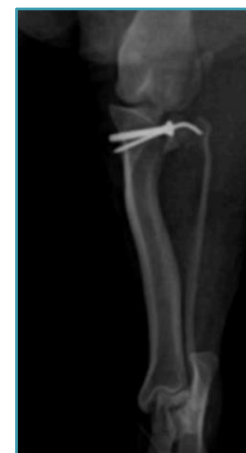
Figura 3: Radiografia pós-operatória crânio-caudal de membro pélvico esquerdo de cão, da raça shihtzu, de 7 anos, evidenciando os implantes e coaptação dos fragmentos.

Ao final da cirurgia foi realizada nova radiografia (Figura 3), colocada bandagem Robert Jones por 72h para redução de edema e conforto da paciente, além de administração de analgésico, antibiótico e anti-inflamatório. No retorno após dez dias da cirurgia, a paciente já apoiava o membro e apresentava deambulação satisfatória para o tempo cirúrgico.