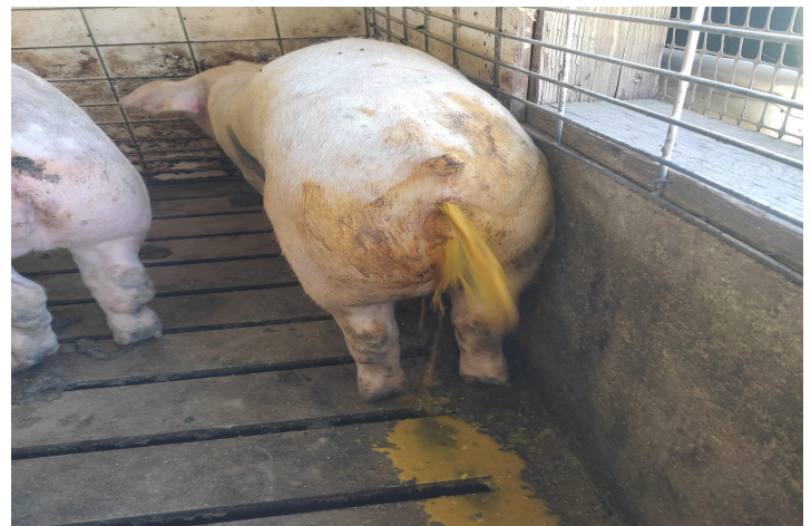
Figura 1: Disenteria líquida em suíno de terminação

desafios com a dieta e o novo ambiente. O período de incubação da doença é variado, podendo ser de 4 dias até 3 meses. Os sinais clínicos começam com fezes amolecidas e amareladas, aumento da temperatura retal e anorexia dos animais, podendo evoluir em pouco tempo, levando a um quadro de diarreia, podendo apresentar muco e sangue nas fezes (Figura 1). A diarreia prolongada leva à desidratação e descompensamento dos animais, na necropsia, os achados macroscópicos são observados no intestino grosso, resultados associados a um quadro de colite muco-hemorrágica, podendo ser observados edema de mesocólon, hiperemia, aumento dos linfonodos mesentéricos, espessamento da mucosa com acúmulo de sangue, e podem ser observados muco, fibrina e material necrótico no lúmen intestinal 3 .