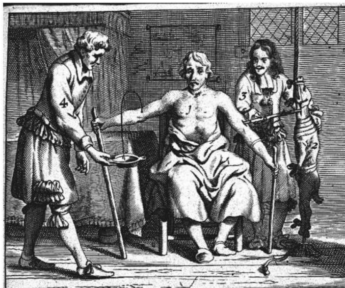
Figura 1: Xenotransfusão de sangue canino para homem.

A xenotransfusão era uma prática comumente descrita na medicina humana na década de 1800 (Figura 1), especialmente mencionada na guerra Franco-Prussiana (1870-1871), contudo ao final desta década, foi demonstrado que as hemácias da maioria dos animais eram hemolisadas no sangue humano devido anticorpos naturais 4 . A partir desta descoberta, a xenotransfusão de animais domésticos para humanos foi abandonada e, em 1900, ocorreu a descoberta dos grupos sanguíneos, possibilitando o desenvolvimento da medicina transfusional intraespecífica, sendo que a medicina veterinária seguiu essa tendência 5 . Os tipos sanguíneos felinos foram descritos em 1950 4 , sendo divididos em A, B e AB, sendo o tipo A o mais encontrado 5 , também há uma segunda divisão com base no fenótipo entre Mik positivo e Mik negativo 6 . Atualmente, devido à relativa dificuldade de encontrar doadores felinos compatíveis em curtos intervalos de tempo, e principalmente após a retirada do Oxyglobin - solução de hemoglobina bovina - do mercado 2 , a xenotransfusão voltou a ser utilizada para estabilização do gato anêmico na indisponibilidade de uma transfusão sanguínea mais adequada.