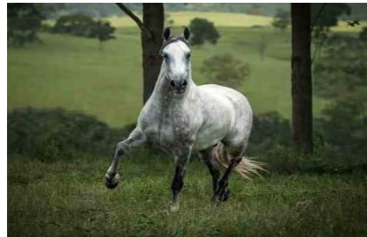
Figura 2: Cavalo Mangalarga Marchador com pelagem Tordilha.

As principais características morfológicas desejáveis da raça são: cabeça de forma triangular, olhos grandes e escuros, a espádua é oblíqua, a cernelha destacada, possui o dorso médio, seu lombo curto e sua garupa ampla, com a cauda de inserção média. Suas pernas são longas e resistentes. As principais características da raça Mangalarga Marchador são a comodidade, docilidade, versatilidade e rusticidade 1,9 .