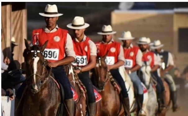
Figura 1: Em pista, os melhores animais da raça em julgamento.

As bases de seleção do cavalo Mangalarga Marchador (fig.2) priorizam o andamento do animal, podendo ser selecionado como marcha picada ou marcha batida. A marcha é um andamento simétrico, natural, a quatro