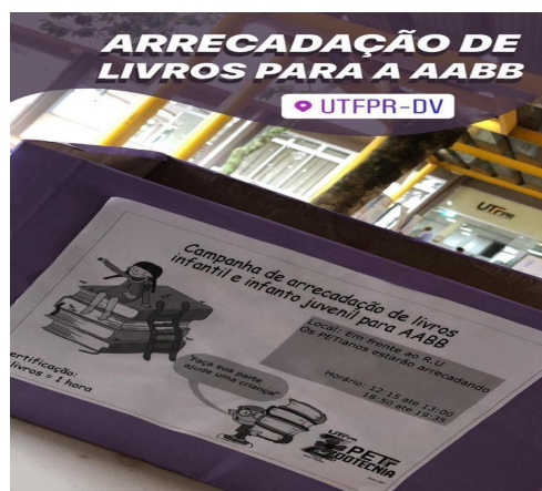
Figura 4: Divulgação nas redes sociais.