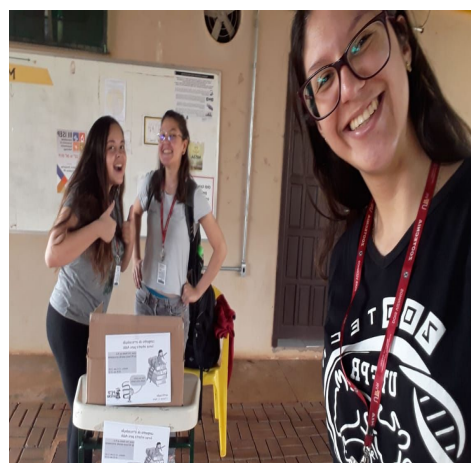
Figura 2: PETianos durante a arrecadação.