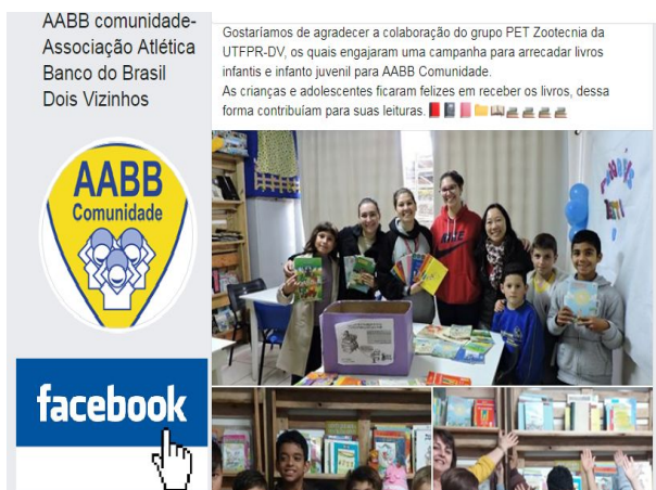
Figura 3: Postagem de agradecimento da AABB.